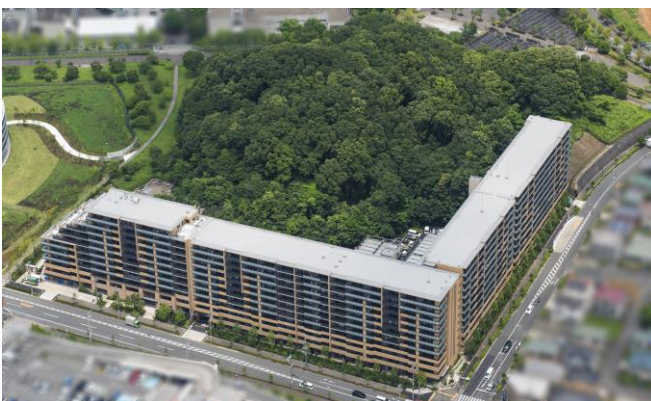
リーフィアレジデンス橋本 外観写真

https://odakyu-fudosan.co.jp/corporate/news/pdf/2020/news200207_02.pdf